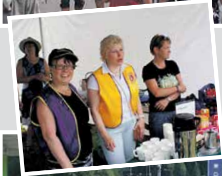
Tunnelmia vuosien varrelta.