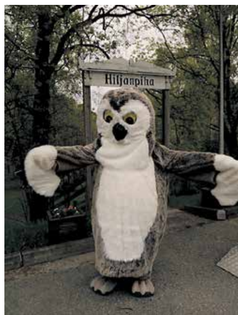
Myös Heinola Pöllö vieraili Kyläpirtin kesänavajaisissa 23.5.